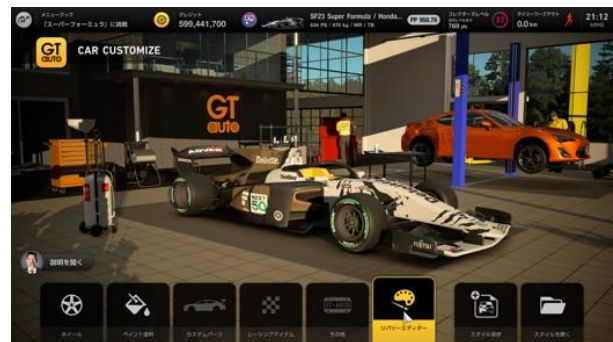
②リバリーエディターを選択