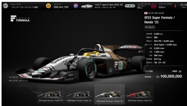
①ブランドセントラルで「SF23」を購入