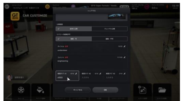
④保存：「シェア」→「全体に公開」を選択

完成したら、スタイル保存を行い、そこに表示される「シェア」を選択し「全体に公開」を選択します。シェアする際には、応募用検索タグの「sf2023」と「no カーナンバー」を記載