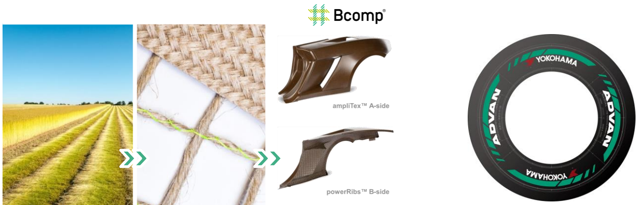
<Bcomp社のバイオコンポジット素材イメージ>

燃料については、Honda・TOYOTA両自動車メーカーと綿密に連携し、22年を通じて「e-Fuel」や「バイオFuel」といった複数のカーボンニュートラルフューエルをテストし、今後の導入に向けて実験を重ねてまいります。