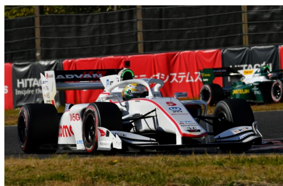
同ポイントで最終戦を迎える、平川 亮(イトウチュウエネクス チーム インパル) (左)と、 山本 尚貴(ドコモ・チーム・ダンディライアン・レーシング) (右)