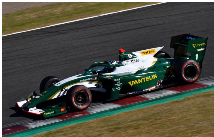
コースレコードでポールポジションを獲得ニック・キャンディ(バンテリン チーム トムス)