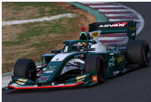
SUGO 大会で、今季初優勝を果たした、ニック・キャンディ(バンテリン チーム トムス)

今シーズンの折り返し点となる今大会。ポイントを獲得していないドライバーは取りこぼしのできないレースが続きますが、今季導入された有効ポイント制と獲得ポイント数の変更により、まだ多くのドライバーにシリーズチャンピオンの可能性が残されており、その行方を占う上でも大切な大会となります。