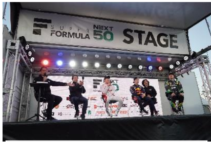
<トークステージの様子>

公式 HP： https://superformula.net/sf3/race/11634/