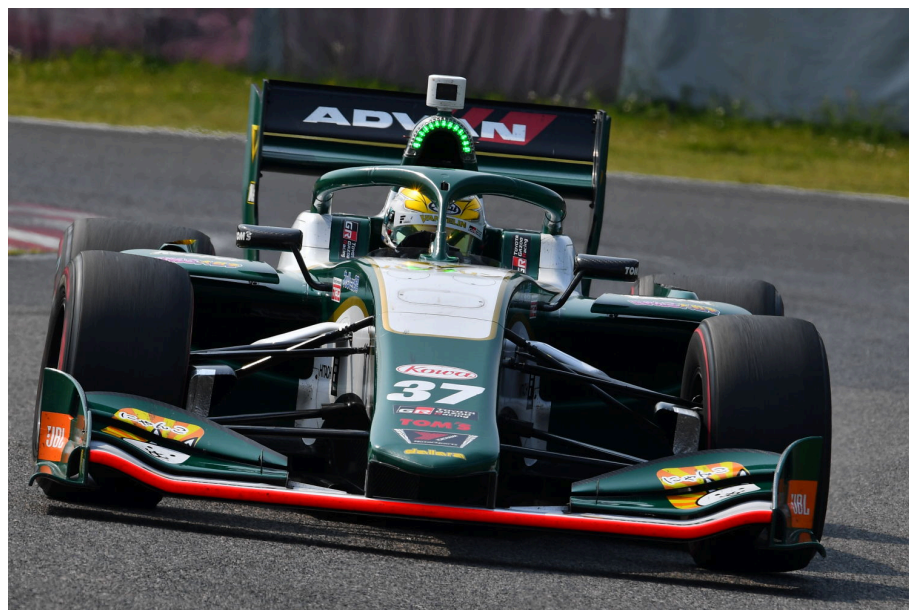
開幕戦を制した、ニック・キャンディ(バンテリン チーム トムス)

まずは金曜日のフリー走行で、ソフトとミディアムのタイム差が大きくなったタイヤを、予選・決勝を見据えどのように組み込んでくるのか? また、山本が「良く出来ている」と評した新オーバーテイクシステムを、このオートポリスでどのように戦略的に使うのか? さらに右回りのコースによる通常とは逆の左側給油やタイヤ交換など各チームのピットワーク、チーム力も見どころです。