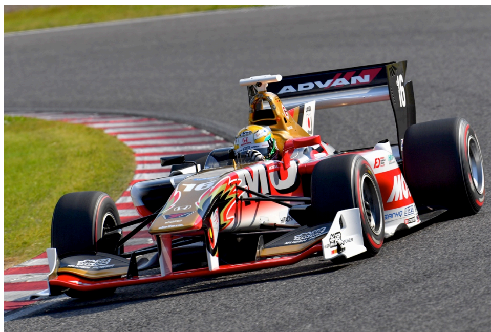
Q1～Q3 全てトップタイムを記録しポールポジションを獲得した山本 尚貴(チーム・ムゲン)