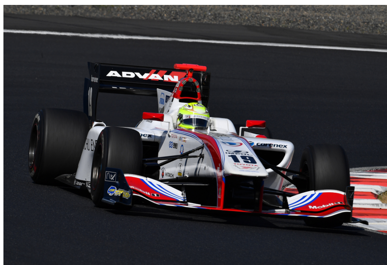
第2戦 Race1のポールポジションを獲得した No19 関口雄飛(イトウチュウエネクスチーム インパル)