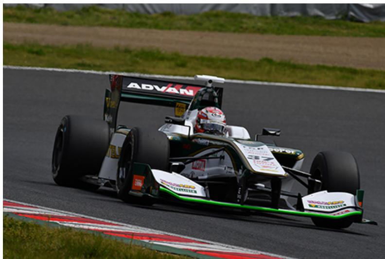
ポールポジションを獲得した No37 中嶋一貴(バンテリニ チーム トムス)