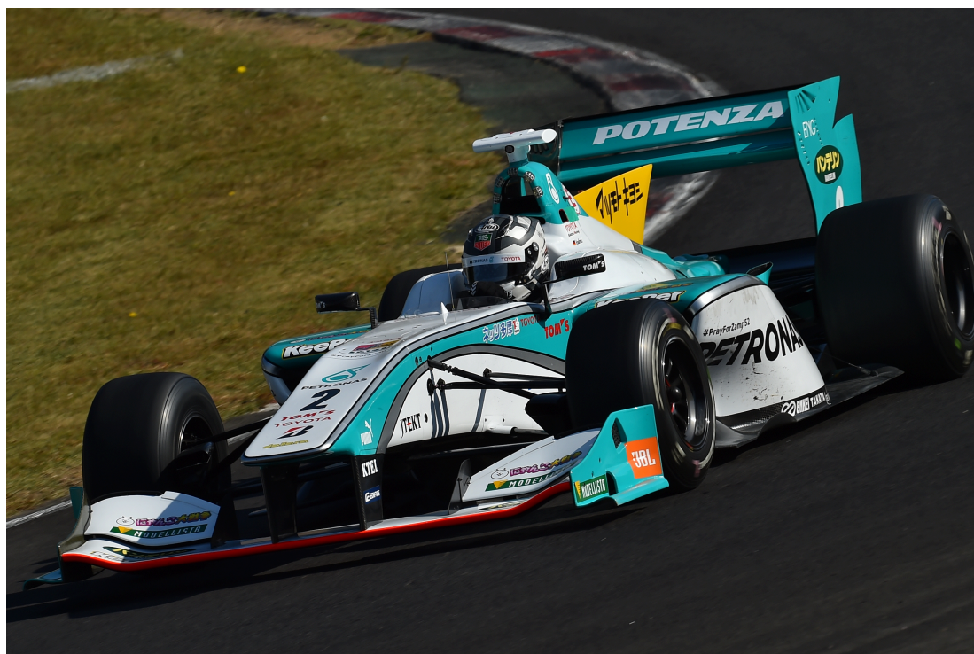
コースレコード更新のタイムで、今シーズン初のポールポジションを獲得した ペトロナス・チーム・トムス #2 アンドレ・ロッチェラー