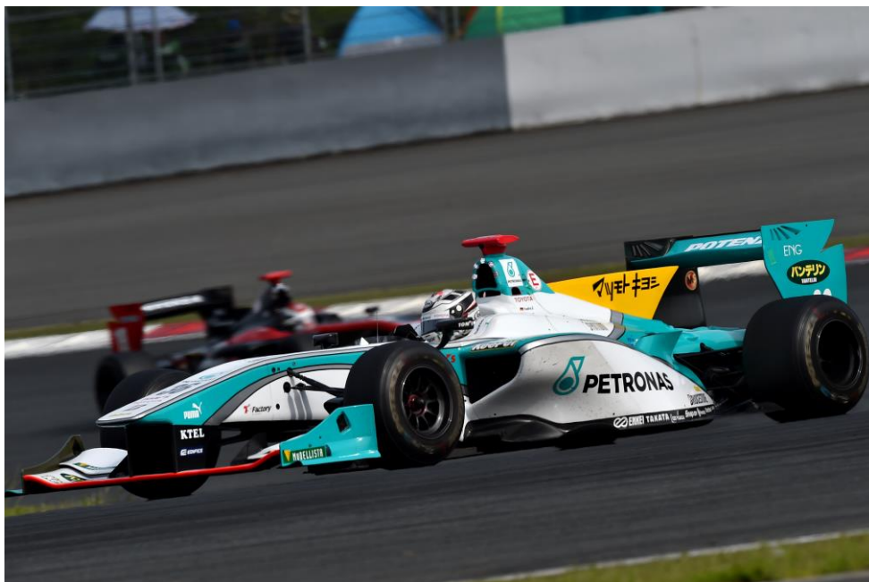
レース2で優勝したアンドレ・ロッターラー（ペトロナス・チーム・トムス）